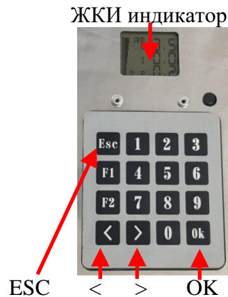
Рис.№1. Расположение элементов интерфейса.

Управление режимами индикации и программирования производится нажатием управляющих клавиш.